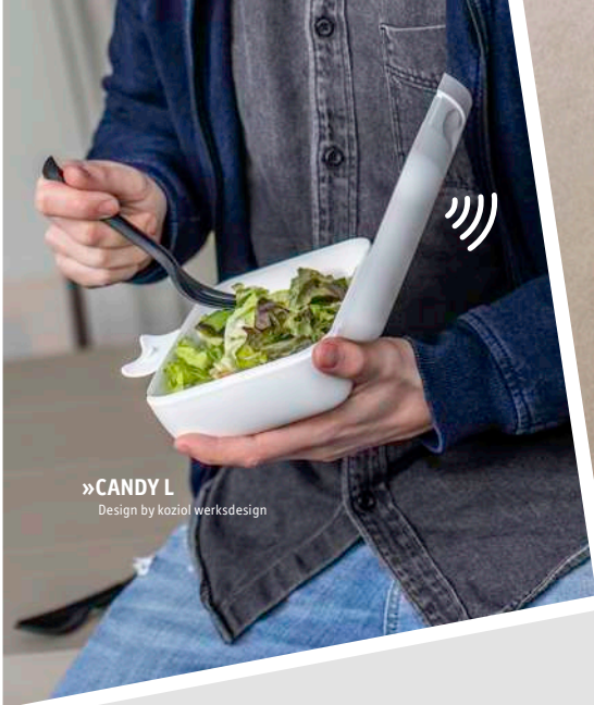
»CANDY L Design by koziol werksdesign