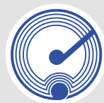
NFC Chip Beispiel (Originalgröße)

www.koziol-incentives.de/NFC incentives@koziol.de