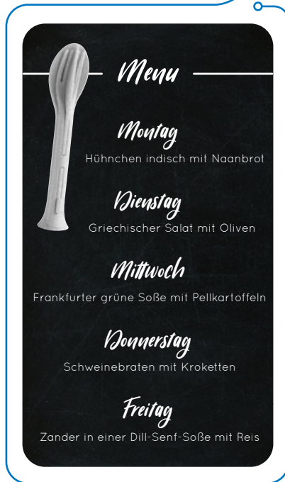
— Für Mittagstisch-Angebote und Online-Speisekarten oder Reservierungstools