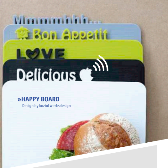
»HAPPY BOARD Design by koziol werksdesign