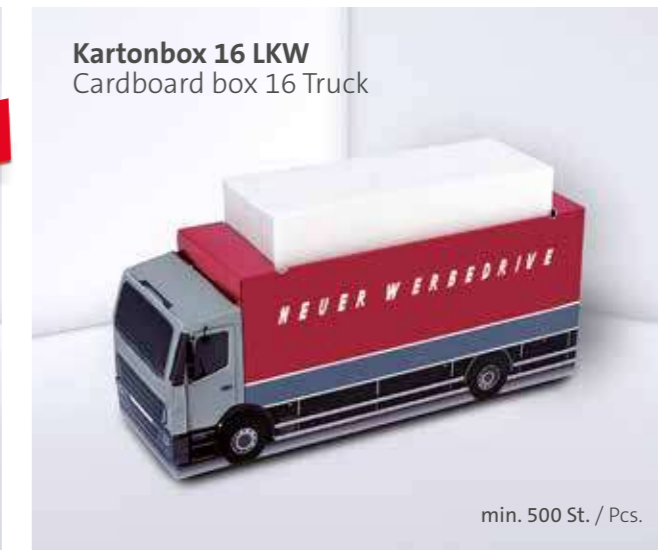
Kartonbox 16 LKW Cardboard box 16 Truck

Weitere Formen wie bspw. Bus auf Anfrage Individual shapes like Bus on request