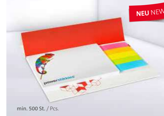
Haftset 25 Adhesive set 25

Auch mit individualisierbarem Papiermarkerset erhältlich Also available with individual paper marker set