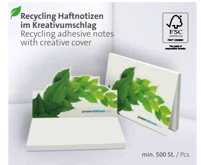
Recycling Haftnotizen im Kreativumschlag Recycling adhesive notes with creative cover