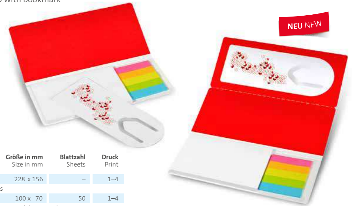
Haftset 03 mit Lesezeichen Adhesive set 03 with Bookmark

Our popular adhesive notes are handy everyday aids that are regularly used, and not only in the office. This makes them the perfect advertising medium for any business that wants to be remembered by its custo- mers. Whether made entirely from sustainable paper or with conventional plastic marker strips – we give you the choice!