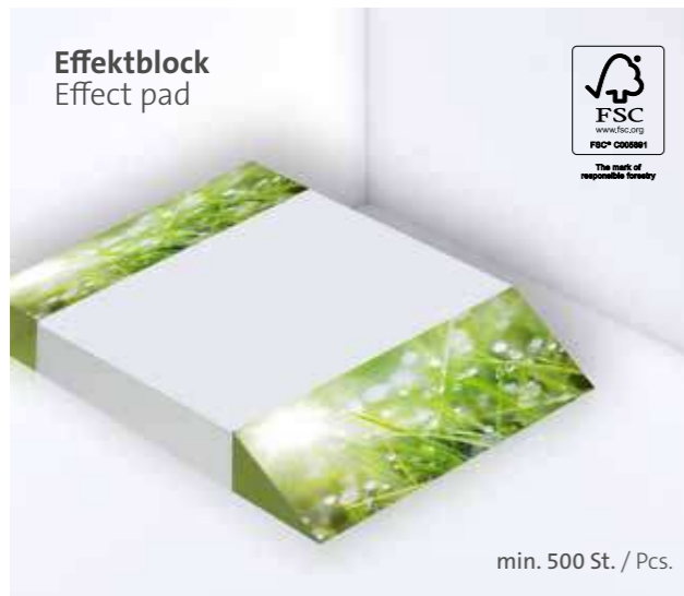
Effektblock Effect pad

Ohne Kugelschreiber, optional mit gestelltem Kugelschreiber erhältlich Without ballpoint pen, optionally available with a posed ballpoint pen