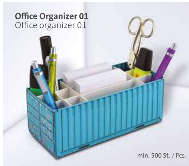
Office Organizer 01 Office organizer 01