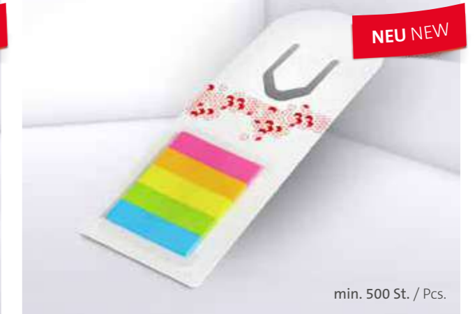
Haftset 26 Lesezeichen Adhesive set 26 Bookmark

Unterstrichenes Maß = Haftseite Underlined dimension = Adhesive side