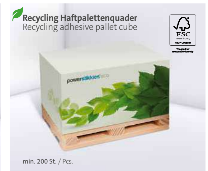
Recycling Haftpalettenquader Recycling adhesive pallet cube

*Zzgl. Holzpalette (ca. 15 mm) / plus wooden pallet (approx. 15 mm)