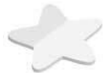
Stern Star , 70 x 70 mm