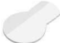
Glühbirne Light bulb , 95 x 62 mm