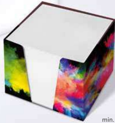
Kartonbox 01 Cardboard box 01