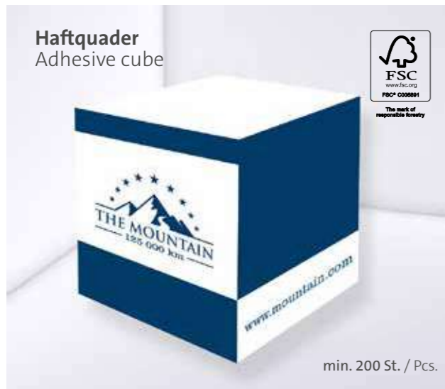
Haftquader Adhesive cube