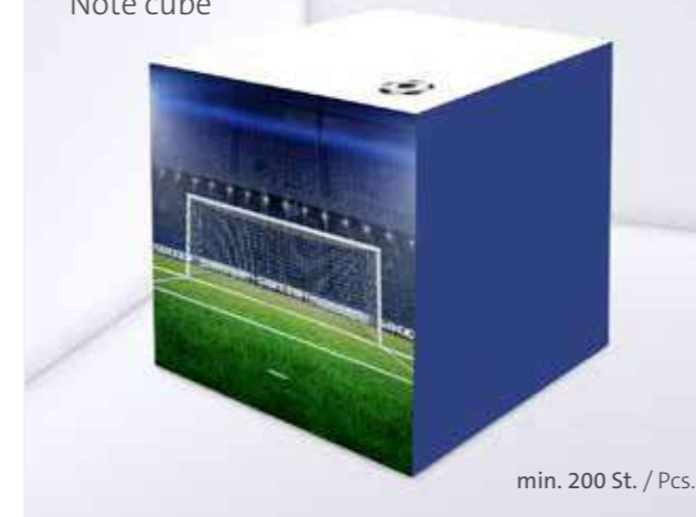
Notizquader Note cube

This is how we use cubes! Printed all around with the design of your choice, staged as a sculpture, punched or with an integrated pen – we offer note pads in many shapes and sizes, fully customisable.