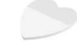
Herz Heart , 63 x 65 mm