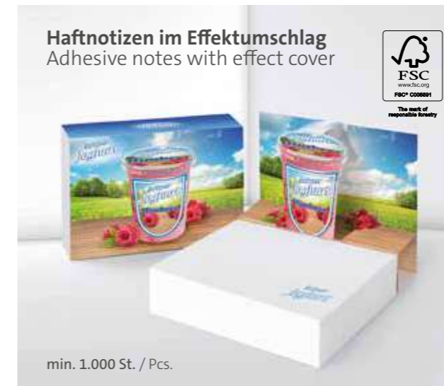
Haftnotizen im Effektumschlag Adhesive notes with effect cover

Unterstrichenes Maß = Haftseite Underlined dimension = Adhesive side