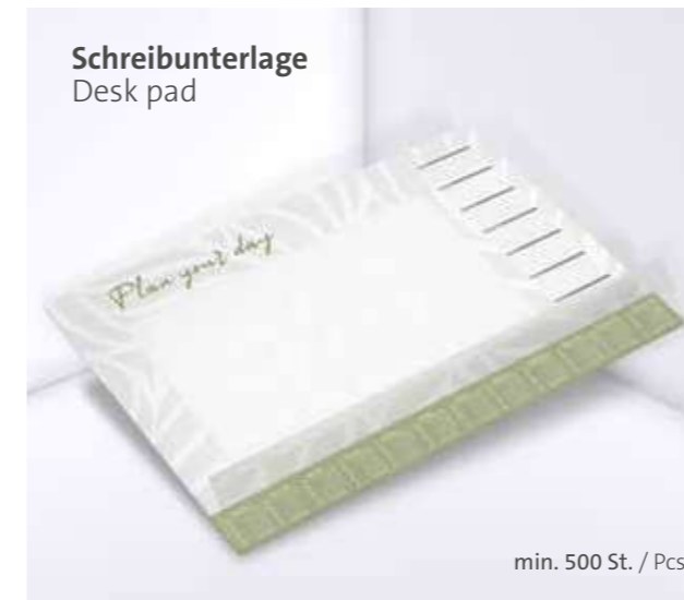
Schreibunterlage Desk pad