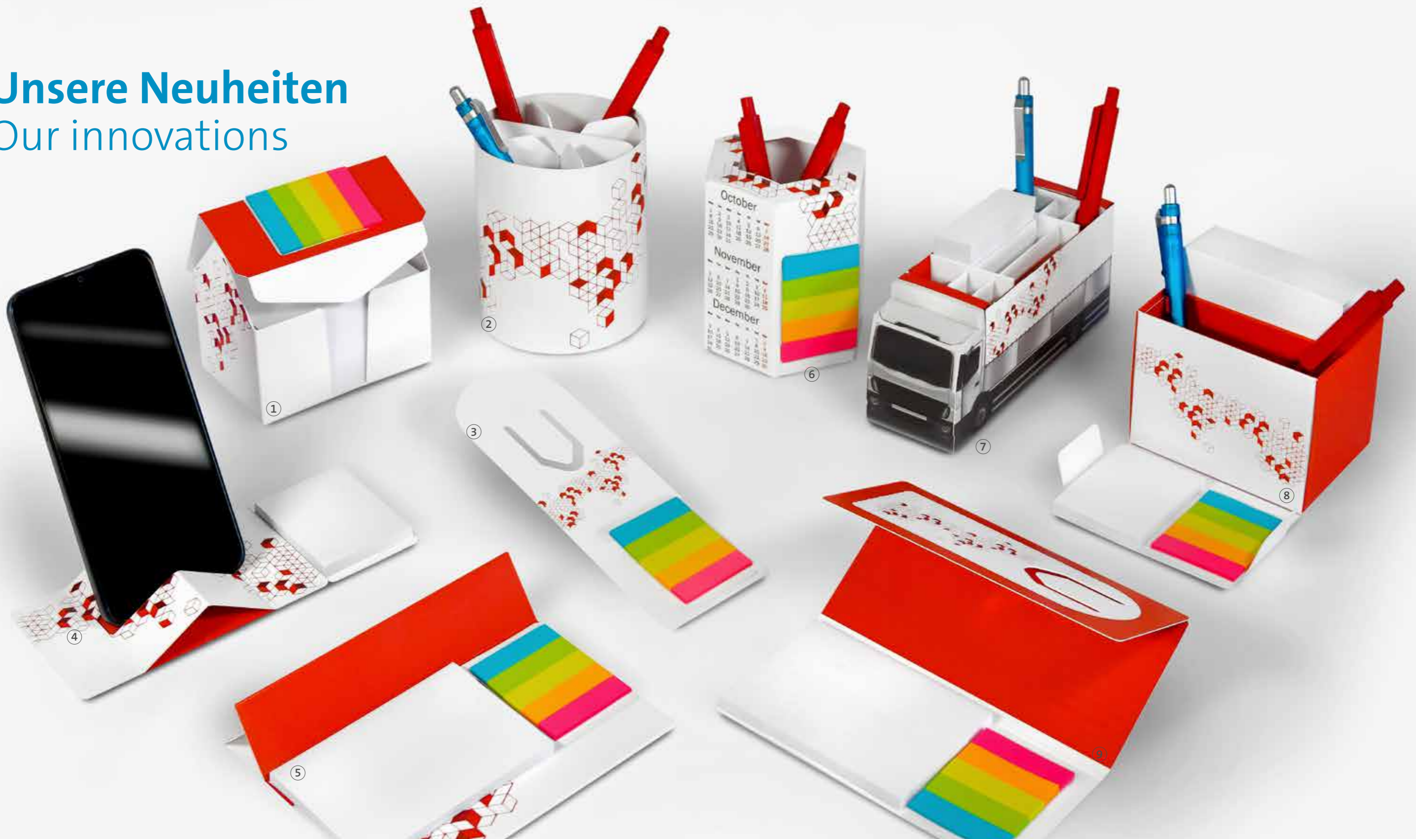
① Kartonbox 10 Haus Cardboard box 10 House Seite 43 page 43