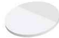
Kreis Circle , 63 x 63 mm