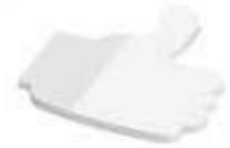
Daumen Thumb , 72 x 67 mm