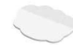
Wolke Cloud , 85,5 x 67 mm