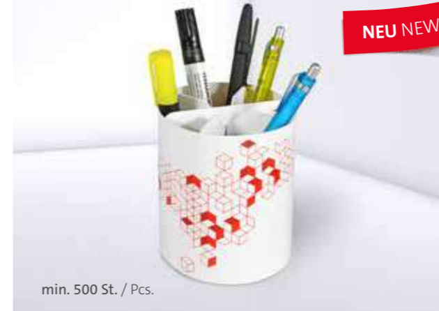
Office Organizer 05 Office organizer 05

Auch mit individualisierbarem Papiermarker set erhältlich Also available with individual paper marker set