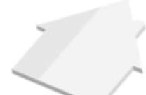
Haus House , 75 x 69 mm