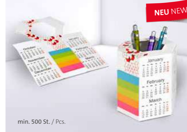
Office Organizer 06 Office organizer 06

Tidy and within easy reach: our cardboard note box is available in a range of shapes and sizes, printed as required, and totally customisable. Whether you want a standard shape or unusual shape – the advertising classic works.