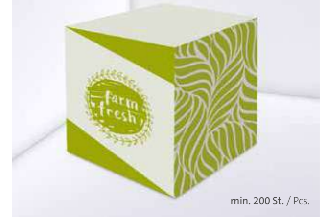
Recycling Notizquader Recycling note cube

Optional Einzelblattdruck 1- bis 4-farbig Offset Optional single-sheet print 1- up to 4-coloured offset