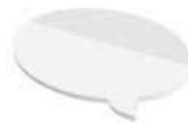
Sprechblase Speech balloon , 98 x 65 mm