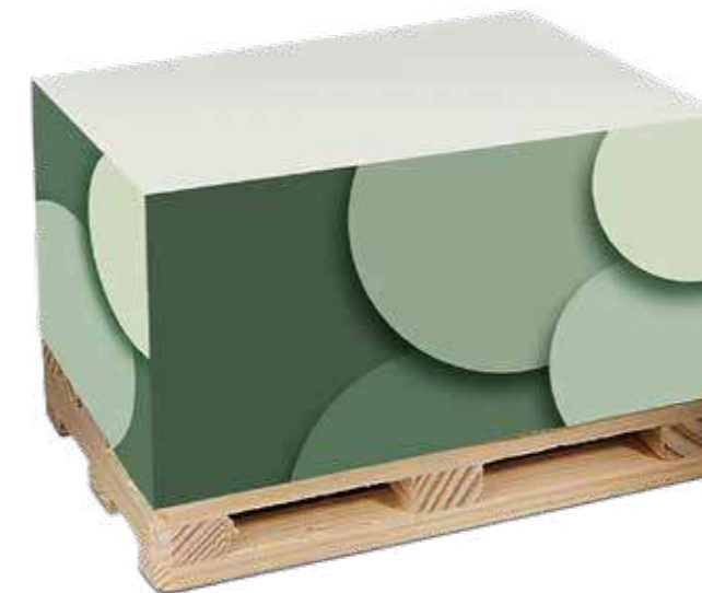
Recycling Palettenquader Recycling pallet cube

Optional Einzelblattdruck 1- bis 4-farbig Offset Optional single-sheet print 1- up to 4-coloured offset