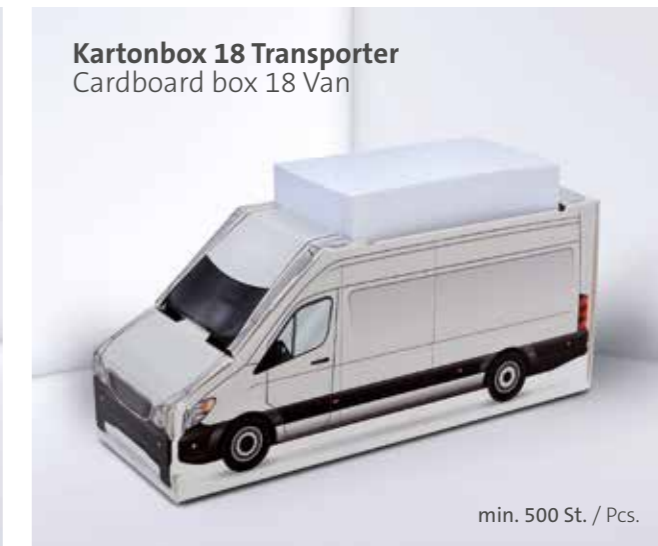
Kartonbox 18 Transporter Cardboard box 18 Van

Individuelle Formen auf Anfrage Individual shapes on request