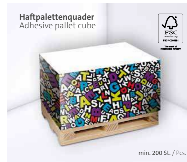
Haftpalettenquader Adhesive pallet cube