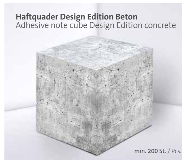
Haftquader Design Edition Beton Adhesive note cube Design Edition concrete