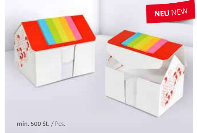
Kartonbox 10 Haus Cardboard box 10 House