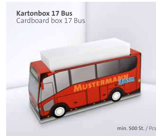
Kartonbox 17 Bus Cardboard box 17 Bus