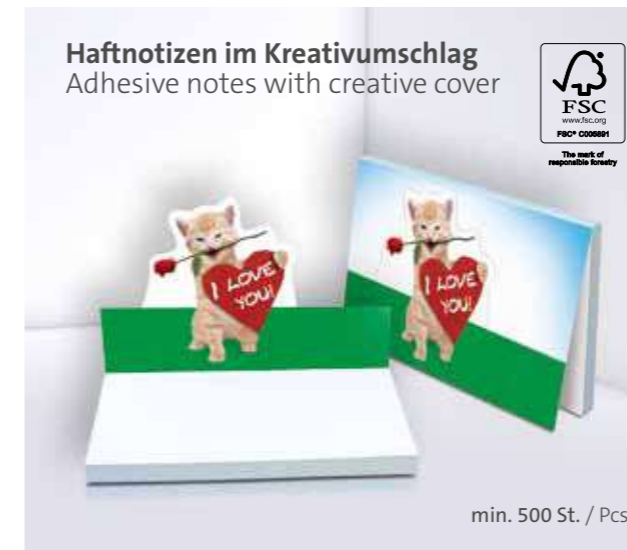
Haftnotizen im Kreativumschlag Adhesive notes with creative cover