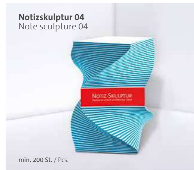
Notizskulptur 04 Note sculpture 04

Optional Einzelblattdruck 1- bis 4-farbig Offset Optional single-sheet print 1- up to 4-coloured offset