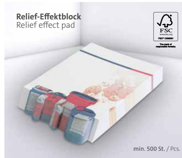
Relief-Effektblock Relief effect pad