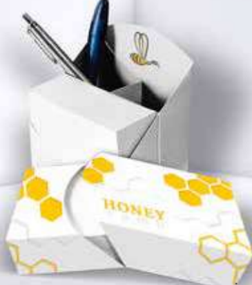
Kartonbox 08 Cardboard box 08