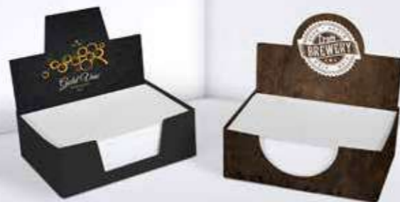
Kartonbox 09 Cardboard box 09