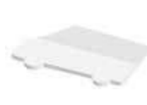
Lieferwagen Van , 94 x 52