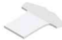
Shirt Shirt , 77 x 70 mm