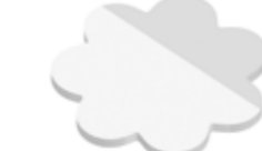
Blume Flower , 65 x 65 mm