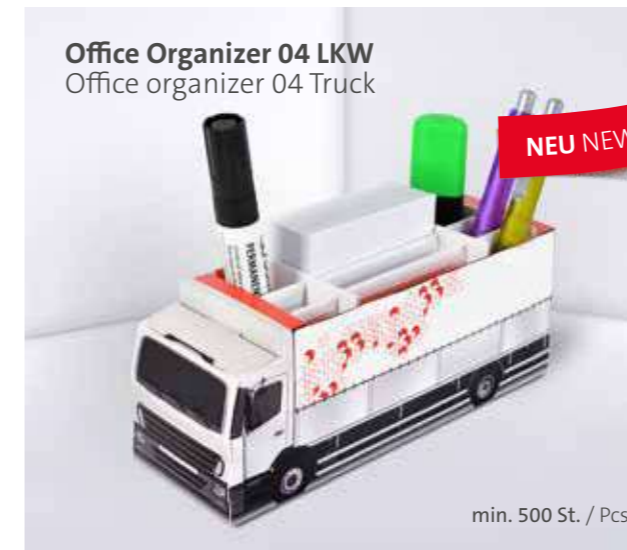
Office Organizer 04 LKW Office organizer 04 Truck