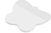
Schmetterling Butterfly , 97 x 69 mm

Unterstrichenes Maß = Haftseite Underlined dimension = Adhesive side