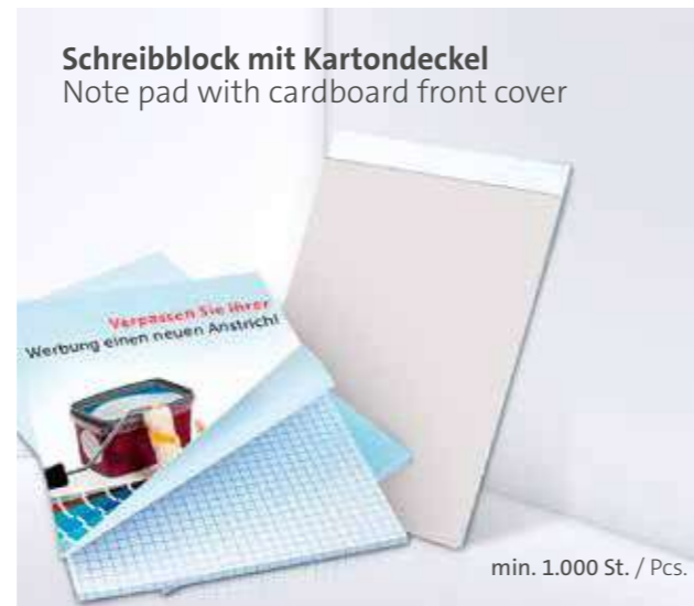
Schreibblock mit Kartondeckel Note pad with cardboard front cover