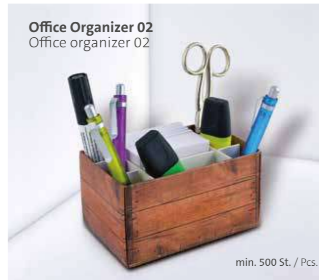
Office Organizer 02 Office organizer 02