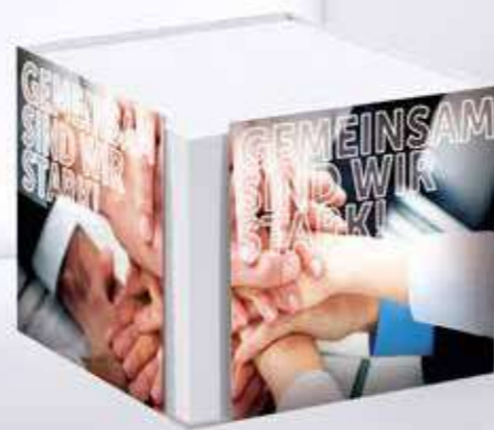
Kartonbox 07 Cardboard box 07