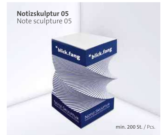
Notizskulptur 05 Note sculpture 05

Optional Einzelblattdruck 1- bis 4-farbig Offset Optional single-sheet print 1- up to 4-coloured offset