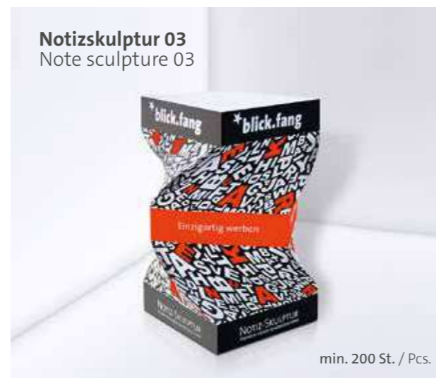
Notizskulptur 03 Note sculpture 03

Optional Einzelblattdruck 1- bis 4-farbig Offset Optional single-sheet print 1- up to 4-coloured offset