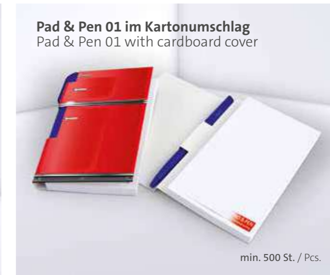
Pad & Pen 01 im Kartonumschlag Pad & Pen 01 with cardboard cover

Optional mit transparenter oder weißer Kunststoffleiste Optional with transparent or white plastic border