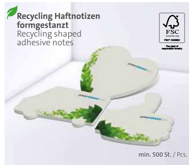
Recycling Haftnotizen formgestanzt Recycling shaped adhesive notes