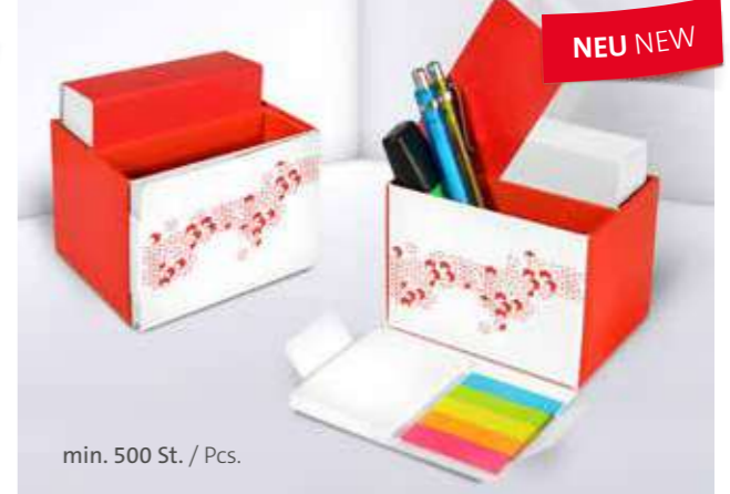
Office Organizer 03 Office organizer 03