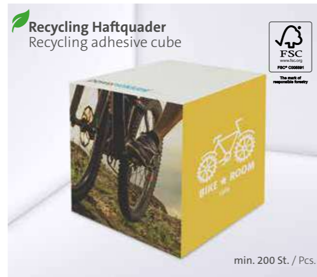
Recycling Haftquader Recycling adhesive cube