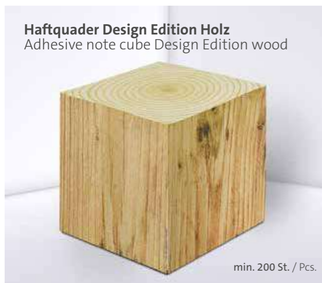
Haftquader Design Edition Holz Adhesive note cube Design Edition wood

The PURE notes adhesive set 04 is both practical and eco-conscious. It is perfect for all important notes, and the paper markers are fully customizable. Sustainable materials such as recycled paper are used, providing a high-quality and natural feel that perfectly completes the overall image.