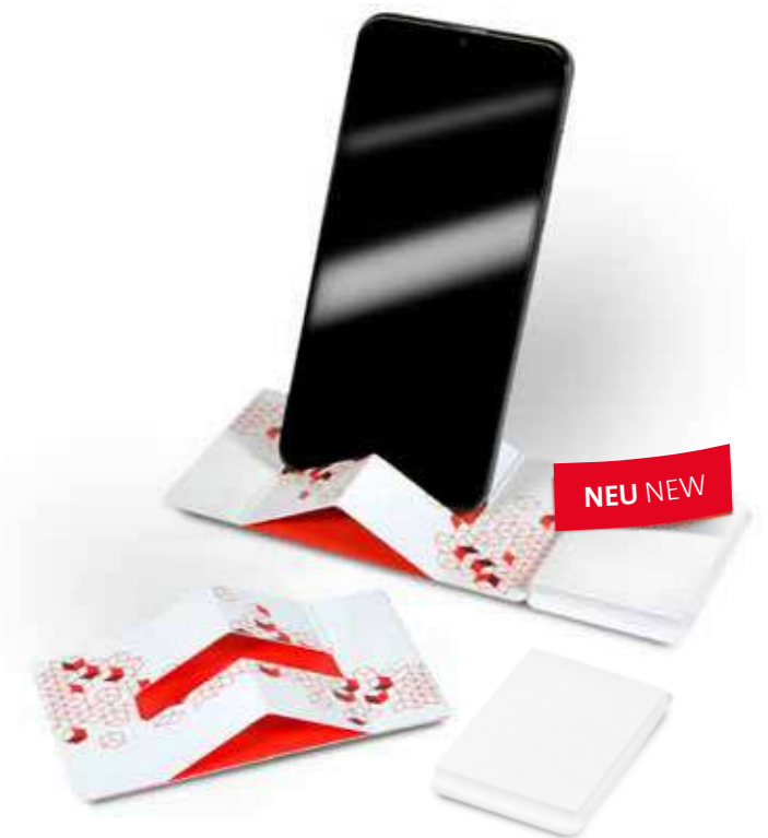
Haftset 27 mit Smartphonehalter Adhesive set 27 with Smartphone holder