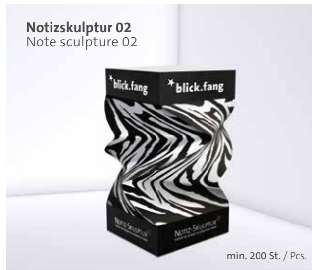
Notizskulptur 02 Note sculpture 02

Optional Einzelblattdruck 1- bis 4-farbig Offset Optional single-sheet print 1- up to 4-coloured offset