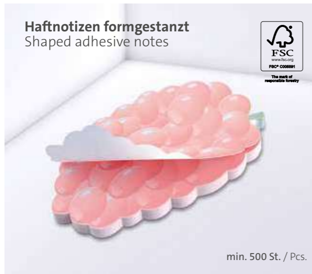
Haftnotizen formgestanzt Shaped adhesive notes